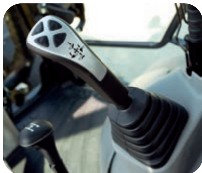
Comandi comodi, ergonomici e precisi

Un monitor LCD da 7" ad alta definizione assicura una visibilità eccellente. Il display LCD ad alta definizione è meno soggetto agli effetti dell'angolo di visualizzazione e della luminosità circostante, garantendo una visibilità ottimale. Vari allarmi e dati macchina sono visualizzati in un formato semplice. Vengono inoltre fornite informazioni utili come i dati storici di funzionamento della macchina, le sue impostazioni e i dati relativi alla manutenzione. L'operatore può navigare facilmente tra le schermate utilizzando intuitivi pulsanti laterali.