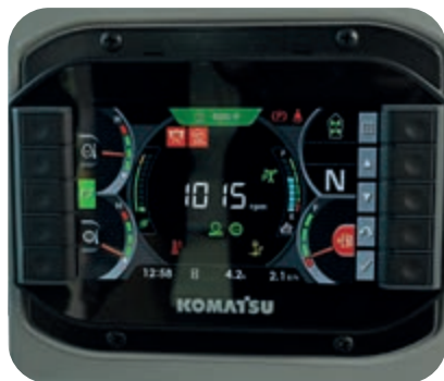
Monitor multifunzione da 7"