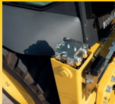
Valvole di sicurezza per stabilizzatori, braccio principale e avambraccio (di serie)